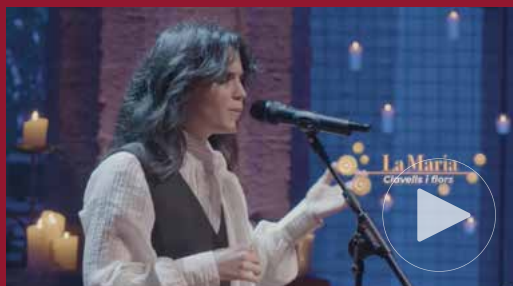
Clavells i flors (À Punt) — 10/12/2024