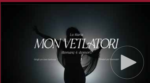
Mon vetlatori — L'Assumció, 2023