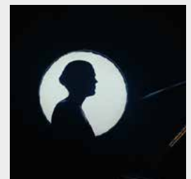
Consagració Single, 2025