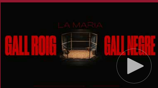
Gall roig, gall negre — 2023