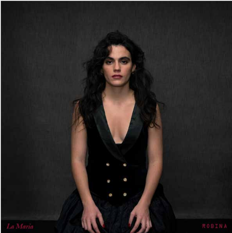
Robina — Àlbum, 2025

Part 1. Ruptura Qui s'ha inventat l'amor? Estupor Perla Part 2. Buit l'U de plorar Deliqui La meua Maria Rita Consagració Part 3. L'enamorament, fandangos Adoració a Robina Havanera papallones Perdona Maria