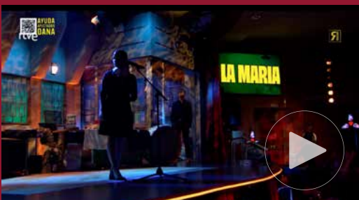
Mon vetlatori (La revuelta) — 04/11/2024