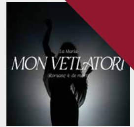
Mon vetlatori Single, 2022

La iaia del piso (La Maria Llorca) D'allà (Romanç 1: Sóc) Clavells i flors (Romanç 2: l'esclat) Amodiño (Romanç 3: de ledicia) Mon vetlatori (Romanç 4: de mort) Sepeli (Romanç 5: d'assumpció) Arranquem vinyes (Romanç 6: i de transformació) La iaia de la mar (La Maria Llorca)