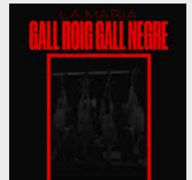
Gall roig, gall negre Single, 2023