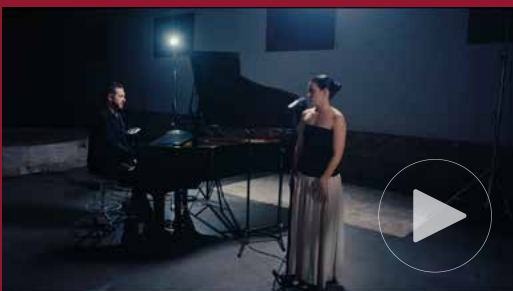
Consagració (Live Session) — Robina, 2025